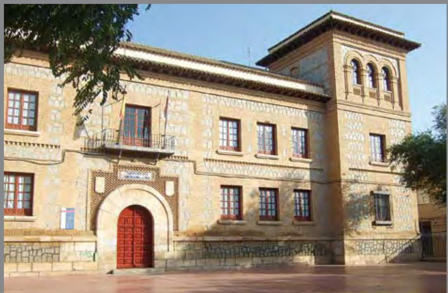
Instituto Garcilaso de la Vega, en la localidad toledana de Madridejos.